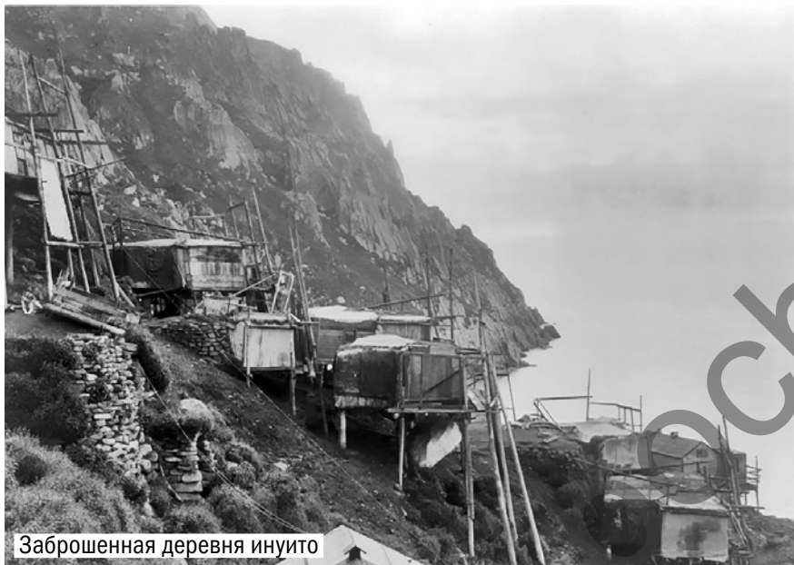
Заброшенная деревня инуито

В Канаде находится территория под названием Нунавут, которая занимает северо-восточную часть страны. Она выделяется своими значительными размерами и очень низкой плотностью населения. Рельеф Нунавута представляет собой преимущественно низкогорную местность с множеством озер, а его флора и фауна характерны для арктической тундры. Климат территории характеризуется суровостью, частыми бурями и длительными зимами. Нунавут насчитывает всего около 30 000 жителей, преимущественно инуитов, которых в других регионах могут называть эскимосами. В 1930-х годах население Нунавута уменьшилось минимум на 30 человек из-за таинственных событий, связанных с озером Ангикуни.