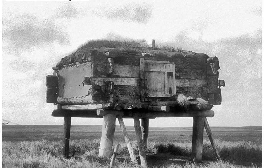
Типичное жилье инуитов

Деревня Растесс, загадка которой до сих пор не разгадана, находится в Свердловской области у берега реки Кырья. Это поселение остаётся заброшенным уже более 60 лет. Его первоначальные жители исчезли при необъяснимых обстоятельствах, и с тех пор никто не осмеливается заселяться там. Сегодня от деревни остались лишь три