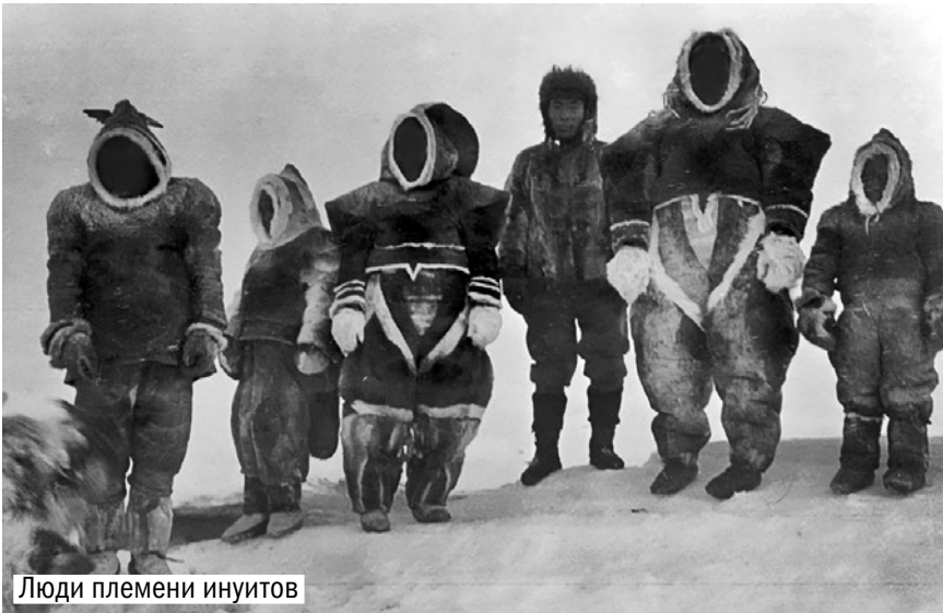
Люди племени инуитов

умием, что привело к коллективному самоубийству.